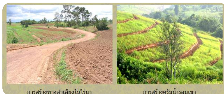
การสร้างทางสายในไรนา