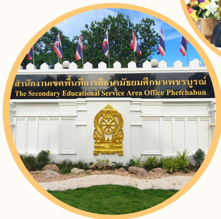
สำนักงานเขตพื้นที่การศึกษามัธยมศึกษาเพชรบูรณ์ The Secondary Educational Service Area Office Phetchabun

สำนักงานเขตพื้นที่การศึกษามัธยมศึกษาเพชรบูรณ์ สำนักงานคณะกรรมการการศึกษาขั้นพื้นฐาน กระทรวงศึกษาธิการ